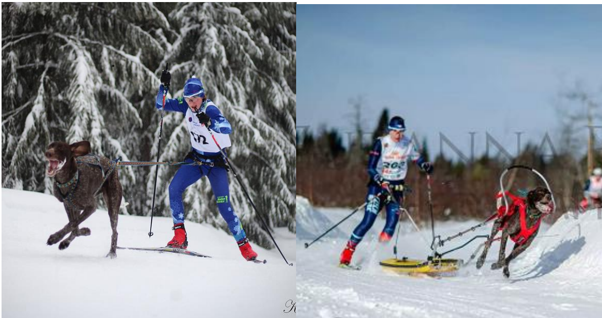
Spřežení (sportovec na saních – káře v zápřahu se psy)